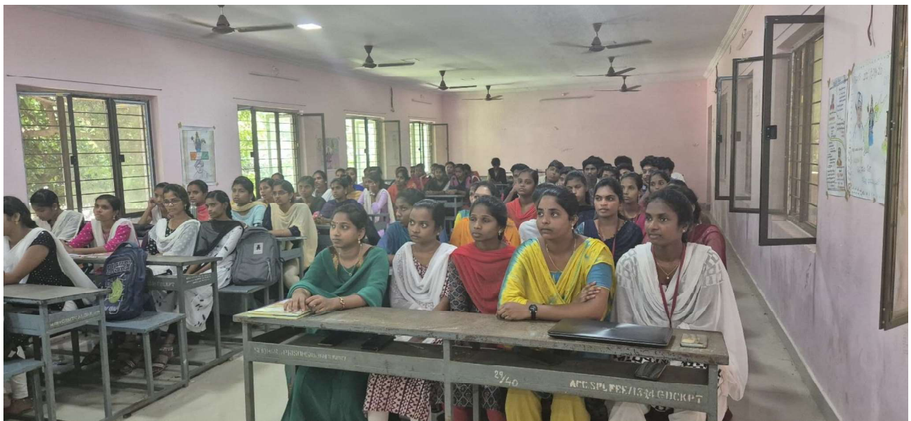
Students from various programmes