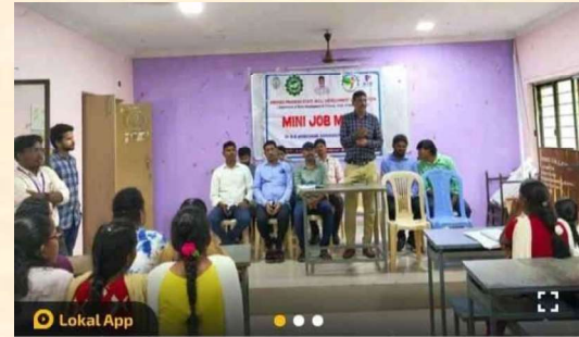
కొత్తపేట: జాబ్ మేళాలో పదిమందికి ఉద్యోగ అవకాశం

Date : 19/10/2024 EditionName : ANDHRA PRADESH( Dr. B. R. AMBEDKAR KONASEEMA ) PageNo : 03